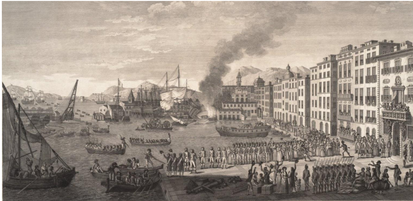
Sbarco inglese a Tolonne